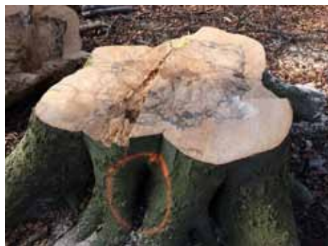
Den sorte aftegning i træstubben er det tydelige tegn på svampesygdommen kulsvamp

De indgreb der bliver gjort mod banens risikotræer spænder fra hel eller