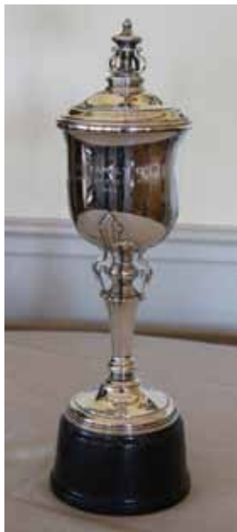
Wessel Family Cup pokalen

Blandt de pokaler, som klubben mener, kan overvintre privat, anser mange Wessel Family Cup som den smukkeste og mest særegne, et fornemt stykke sølvsmedearbejde, ”Made in England”. Beklageligvis havde en vinder, hos hvem den var overvintret privat, forlist sokkelen og vidste ikke, hvor den var blevet af!! Til fodboldegnede den sig i hvert faldt ikke. Den var formodentligt af en slags lak. Heldigvis havde de nye vindere, moder og søn, en ægtefælle, som med sin fader i en fjern fortid havde vundet og ladet fotografere pokalen, og med fotoet i hånd lod de eftergøre en ny sokkel, af træ og fik den lakeret. Det var et omfattende arbejde, før trofæet atter lignede sig selv.