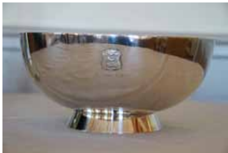
5. maj pokalen

”Tavlematcherne”s præmier er de fineste og de fleste, dog med det forbehold at montren indeholder pragtstykker, som er doneret som præmier til mesterskaber o. l., der imidlertid ikke spilles mere eller i øjeblikket.