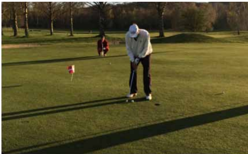
Som Monty siger: Sjusk ALDRIG med et putt, og slet ikke på 18. hul! Flaget markerer nærmest hullet i 3 slag – en af dagens mange præmier

år og har et SPH på max 36 er du meget velkommen. Bestyrelsen vil sørge for, at nye medlemmer bliver vel introduceret til medlemmerne og rutinerne.