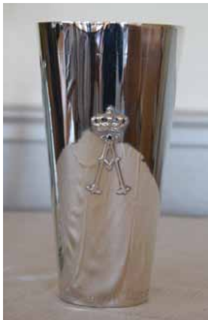
Dronning Alexandrines Vandrepokal

Kong Christian X fyldte d. 26. september 1940 70 år og i den anledning