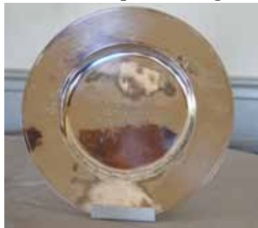
Rungsted Ugens Ægteskabs-pokal