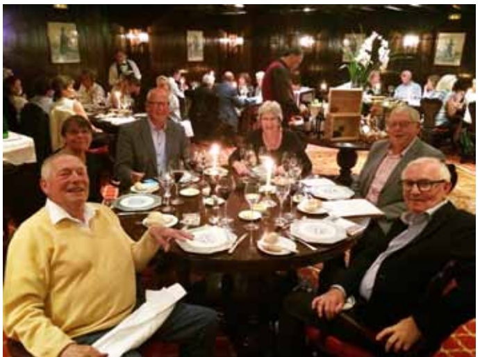
Højt humør og godt selskab ved afskedsmiddagen i Penina