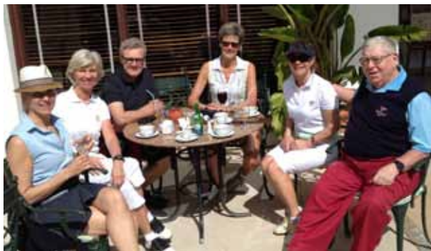
En af de mange hyggelige stunder på terrassen i Penina

P enina Golf resort i Portugal er et populært sted. Ikke mindst blandt Rungsted Golf Klubs medlemmer.