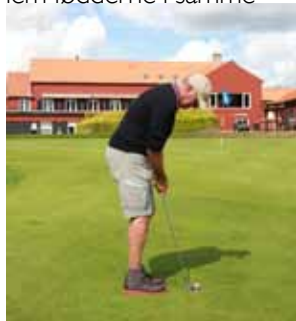
Her illustreres opstillingen tættere på bolden.

Bolden ligger midt imellem fødderne i samme