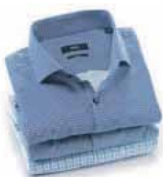
BOSS SKJORTER FRA 900,-