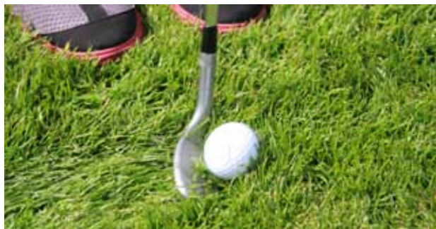
Her illustreres hvor nemt og hurtigt bolden løftes ud af roughen.