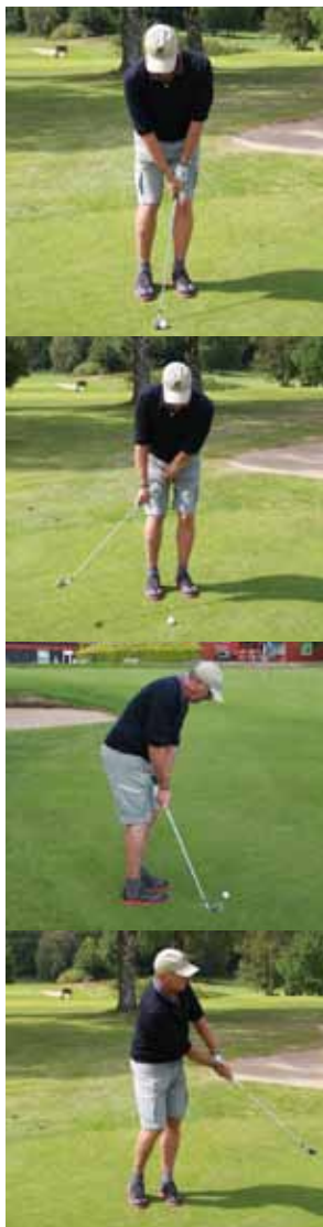
Øverst den korrekte opstilling, i midten det korrekte tilbagesving også set ned af linien og nederst den korrekte afslutning.

I ned- og fremsvinget er det vigtigt at holde overkroppen over bolden,