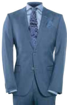
BOSS HABITTER FRA 4.300,-