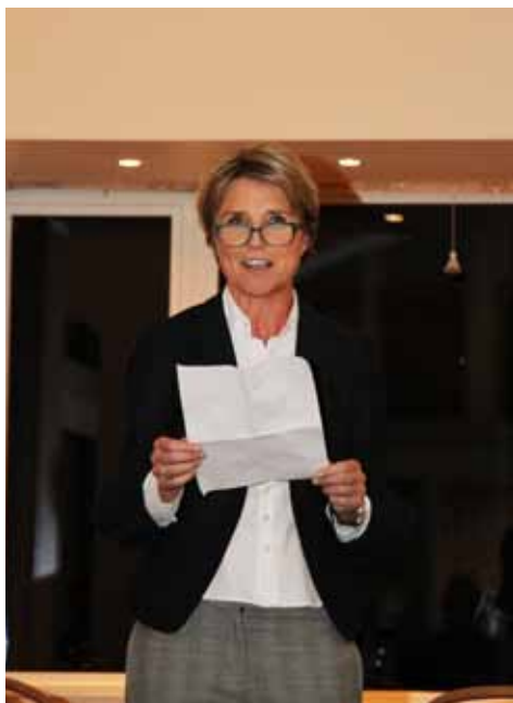
Bettina takker alle frivillige medhjælpere og håber ingen er blevet glemt