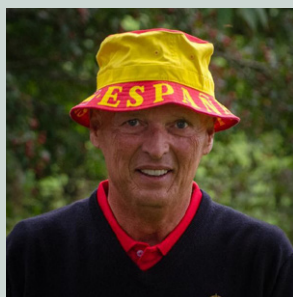
Si senior: Ingen tvivl om hvor denne herre var fra.