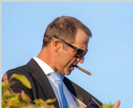
En slovensk spiller måtte have sig lidt tobak under åbningsceremonien.