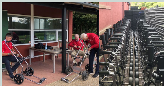
Sekretariatet måtte købe paraplyholderne til i alt 90 vogne, som villige gør det selv-mænd skruede på. 60 af holderne sidder nu på klubbens egne vogne (th.).