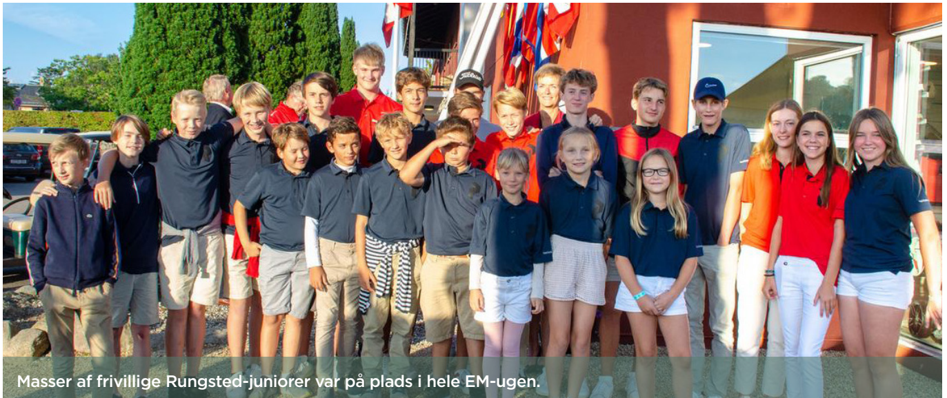
Masser af frivillige Rungsted-juniorer var på plads i hele EM-ugen.