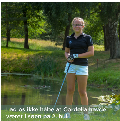
Lad os ikke håbe at Cordelia havde været i søen på 2. hul