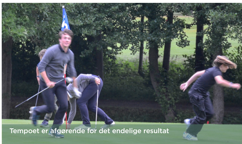
Tempoet er afgørende for det endelige resultat