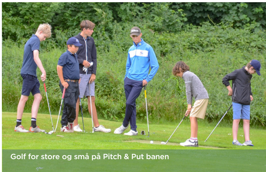
Golf for store og små på Pitch & Put banen