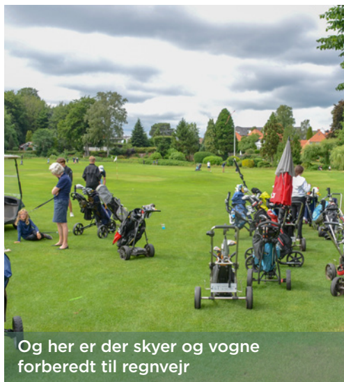
Og her er der skyer og vogne forberedt til regnvej