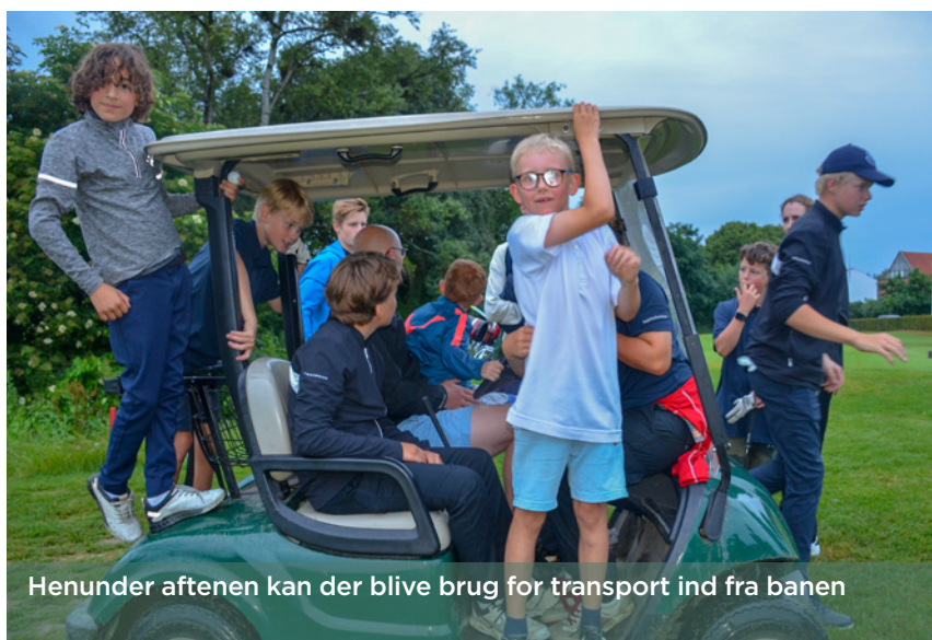
Henunder aftenen kan der blive brug for transport ind fra banen