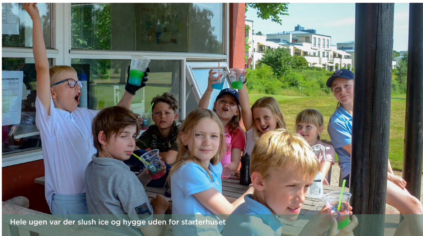
Hele ugen var der slush ice og hygge uden for starterhuset