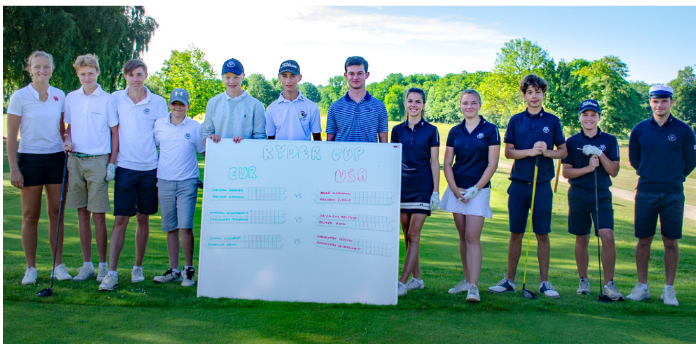
USA i hvidt til venstre og Europa i blåt til højre