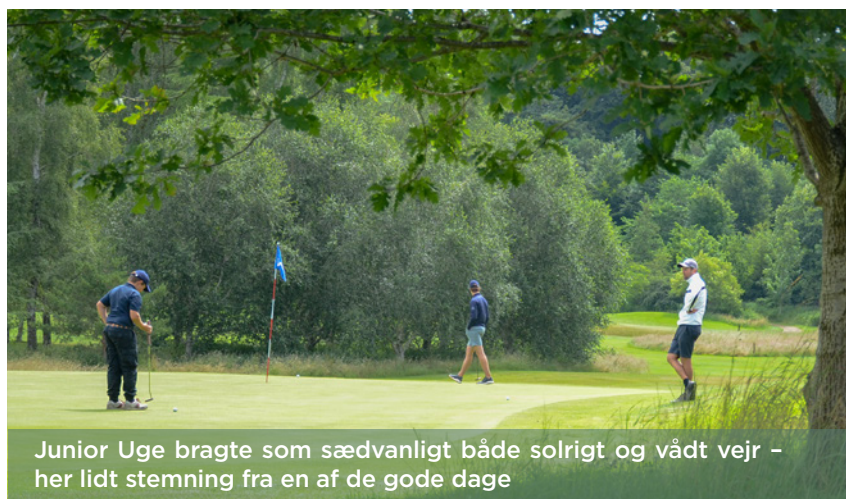
Junior Uge bragte som sædvanligt både solrigt og vådt vejr - her lidt stemning fra en af de gode dage