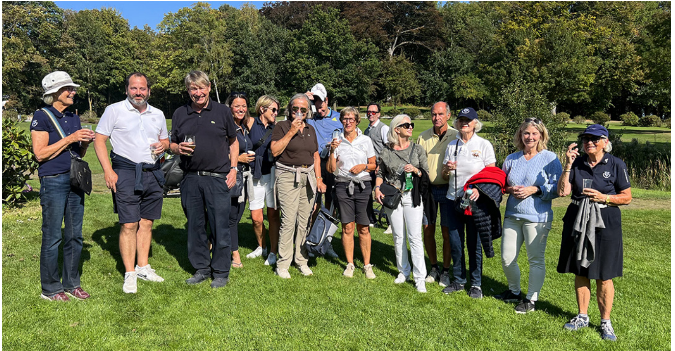
Imponerende mange medlemmer havde taget turen til Korsør for at støtte seniorerne.

holdet ikke nåede finalerne, men blev slået af Kokkedal (som så i øvrigt blev suveræne danmarksmestre), så fik RGK indfriet alle mål.