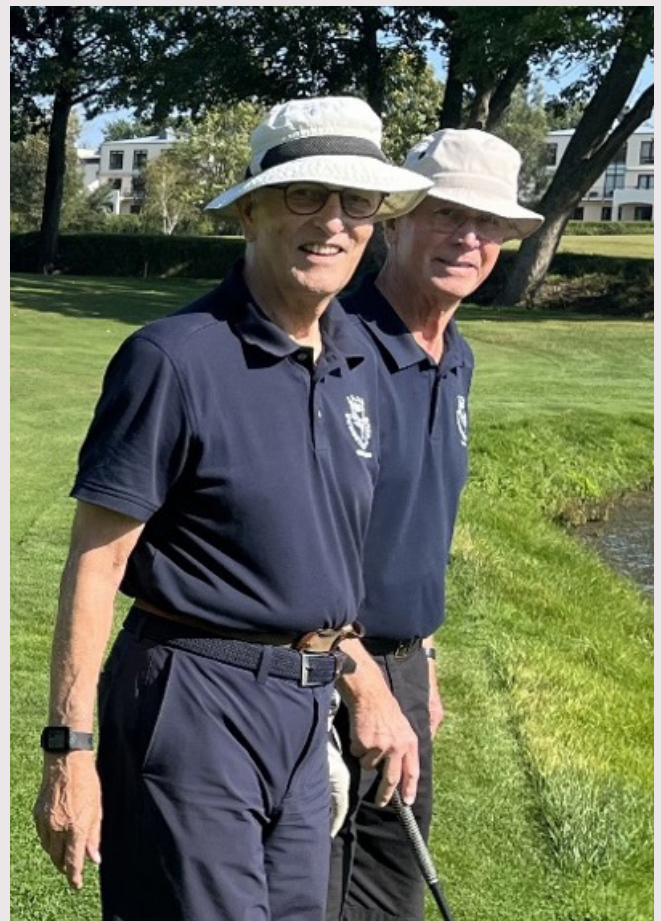
Glade medlemmer af Seniorklubben klædeligt iført Seniorklubbens nye polo shirts.

Dette bidrager til yderligere at styrke sammenholdet og lette integrationen af nye medlemmer.