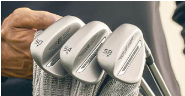
De nye Titleist Vokey SM11 wedges er snart på hylderne.

ZT er designet til at give maksimal stabilitet og præcision på greenen. Gennem en innovativ vægtfordeling minimeres vridmomentet (torque) i køllehovedet, hvilket sikrer, nul vridmoment (zero torque) i puttebevægelsen. Dette resulterer i et mere konsekvent boldtræf og en præcis boldstart.